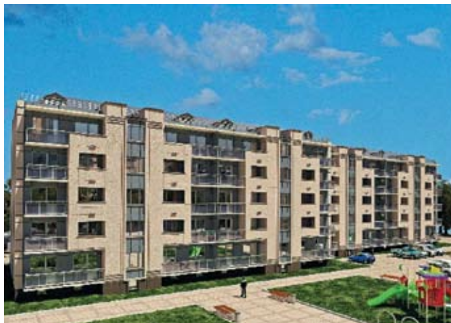
Рис. 4. Унифицированная пятиэтажная блок-секция жилого дома ТИП 2 в Индустриальной Домостроительной Системе

Здания каркасно-панельного типа конструктивно представляют собой пространственный каркас, который образуется при помощи внешних опорных стоек-колонн и ребристых панелей перекрытия. К стойкам каркаса крепятся панели стен и внутренних перегородок, которые являются несущими.