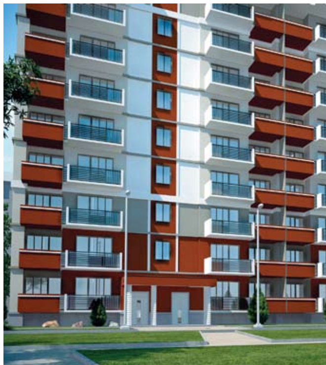
Рис. 1. Унифицированная девятиэтажная блок-секция жилого дома ТИП 2 в Индустриальной Домостроительной Системе

В настоящее время в Казахстане начинается строительство современных сейсмостойких домов по типовым проектам. При этом унификация отдельных видов работ позволяет значительно снизить стоимость строительства (рис. 1).