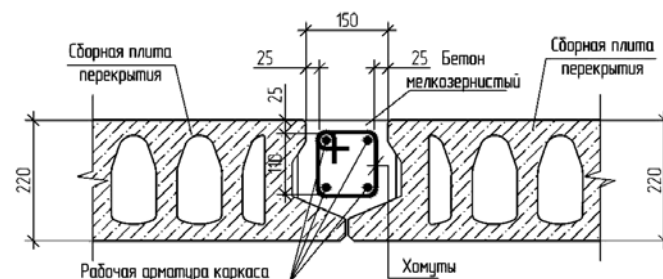
Рис. 3. Узел армирования шва между плитами

При создании сейсмостойкого каркаса используется принципиально новая конфигурация плиты перекрытия, позволяющая доармировать шов между плитами (рис. 3).